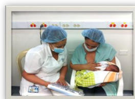
Figura 3 Programa de Lactancia Materna .Fotografía obtenida y publicada previo consentimiento