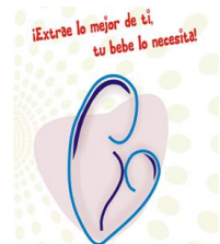
Figura 1. Programa de lactancia materna Logo del programa.2018.

Describir como desde el programa de Lactancia Materna “Extrae lo mejor de ti” la aplicación de una teoría de enfermería de mediano rango en el quehacer profesional, aporta al fortalecimiento del componente disciplinar de la profesión y disminuye la brecha entre la teoría y la práctica.