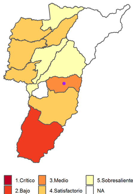
Mapa 1: Municipios por categoría del Índice Gen Cero 2017 Gráfico 1: Ranking municipal según valor del Índice Gen Cero 2017

Agrupar a nivel municipal variables relacionadas con la desnutrición crónica infantil, con el fin de localizar y cuantificar la situación de la problemática en el territorio nacional año a año. Para ello, se construye un indicador sintético que resume el comportamiento de (12) variables asociadas a la situación nutricional: 1. Bajo peso al nacer (menor a 2.500 gramos), 2. Orden de nacimiento, 3. Proporción de nacimientos de madres adolescentes entre 10 y 19 años, 4. Proporción de nacimientos de madres con primaria, 5. Proporción de nacimientos de madres con secundaria, 6. Afiliación a salud, 7. Proporción de nacimientos de madres con menos de 4 consultas antes del parto, 8. Partos institucionales, 9. Partos atendidos por personal calificado, 10. Cobertura de acueducto, 11. Índice de Riesgo de la Calidad del Agua y 12. Mortalidad en la Niñez. El Índice permite hacer lecturas municipales, que enriquecen el análisis sobre la problemática y brindan elementos para la toma de decisiones, en atención a la desnutrición crónica infantil. A continuación, encontrará la clasificación correspondiente a la información disponible para el año 2017 del municipio, la cual se clasifica entre uno (1) y cinco (5), siendo uno (1) el nivel Crítico (rojo) y cinco (5) el nivel Sobresaliente (amarillo).